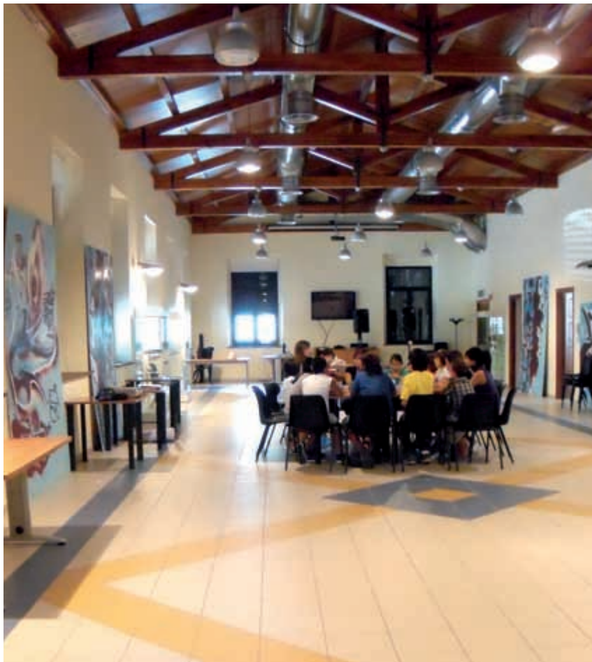
Centro polivalente, piazza I maggio