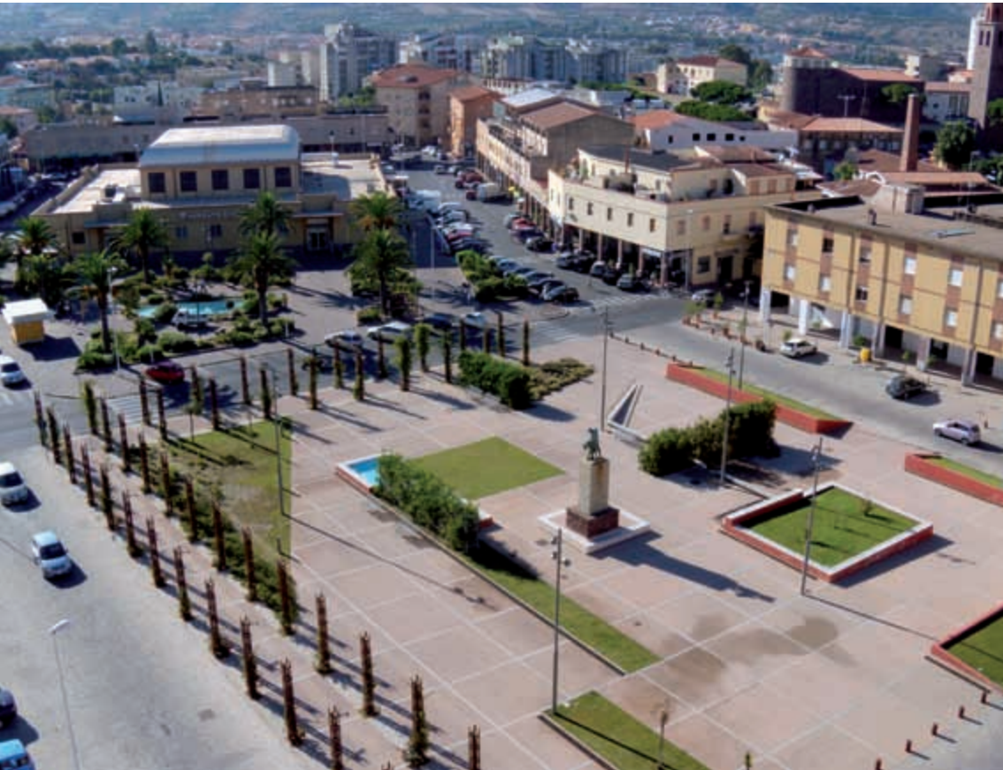
Panoramica, piazza Rinascita