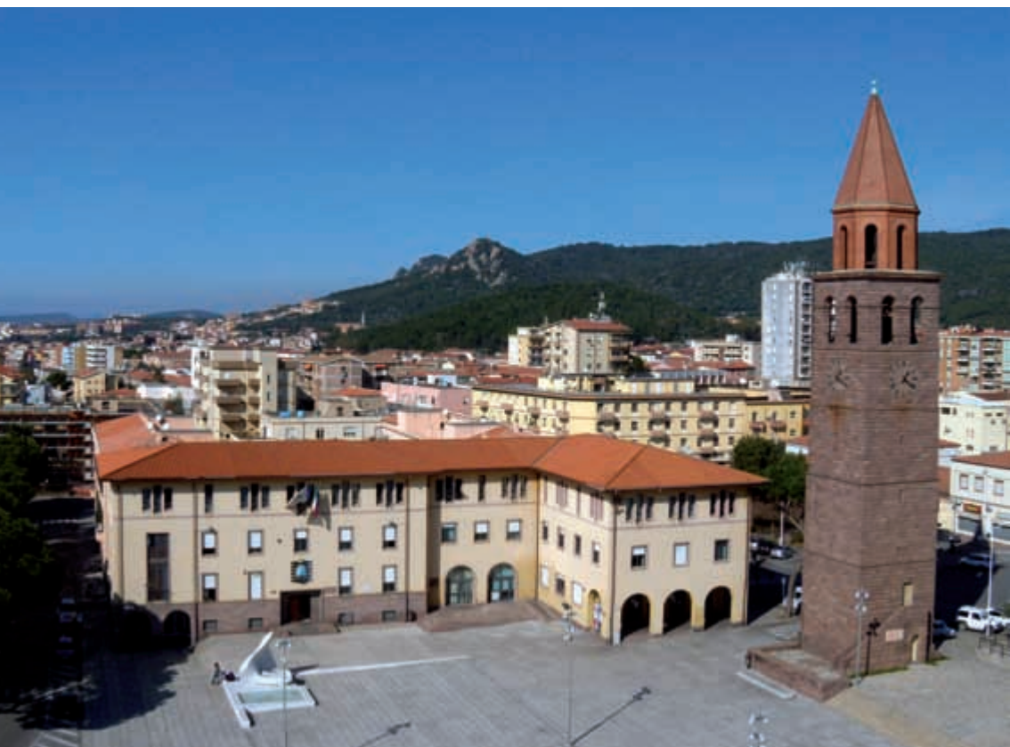
Palazzo comunale, piazza Roma

E-mail: info@comune.carbonia.ca.it apusceddu@comune.carbonia.ca.it mcorrias@comune.carbonia.ca.it