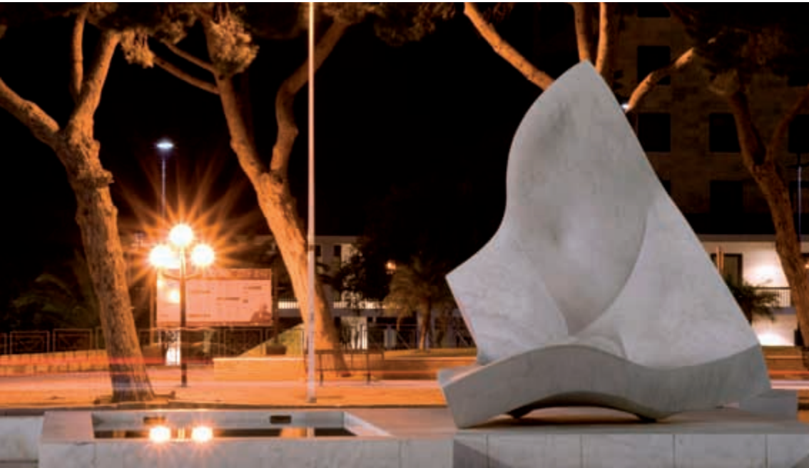
Frammento di vuoto, Carbonia di notte - foto Carlo Di Bella

Si ringrazia Carlo Di Bella e Fabiana Pili per le fotografie messe a disposizione