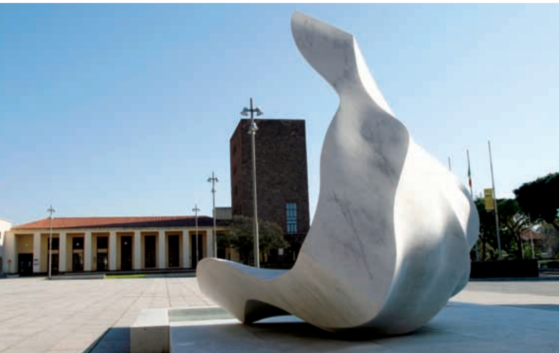
Piazza Roma

Avvertenza: alcune indicazioni relative a sedi, orari, recapiti telefonici, indirizzi di posta elettronica e servizi offerti potrebbero subire modifiche successive alla stampa della Guida. È opportuno, dunque, contattare gli uffici per verificare che non vi siano variazioni, soprattutto in particolari periodi dell'anno (agosto e festivi). L'Amministrazione non è responsabile delle eventuali conseguenze dovute a possibili cambiamenti nell'organizzazione degli uffici e dei servizi.