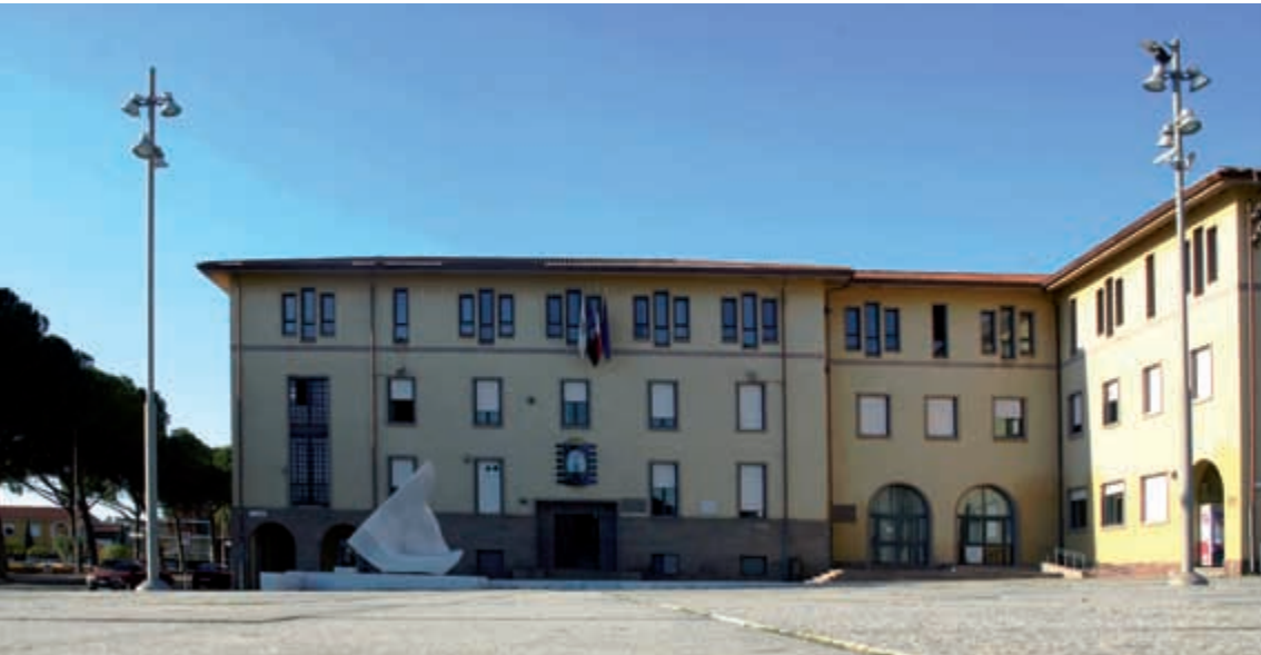
Palazzo comunale