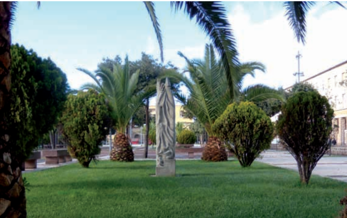
Piazza Venezia, Cortoghiana