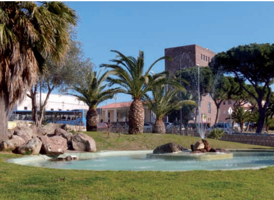
Piazza Marmilla, particolare della fontana

Martedì e giovedì, dalle 16.00 alle 20.00