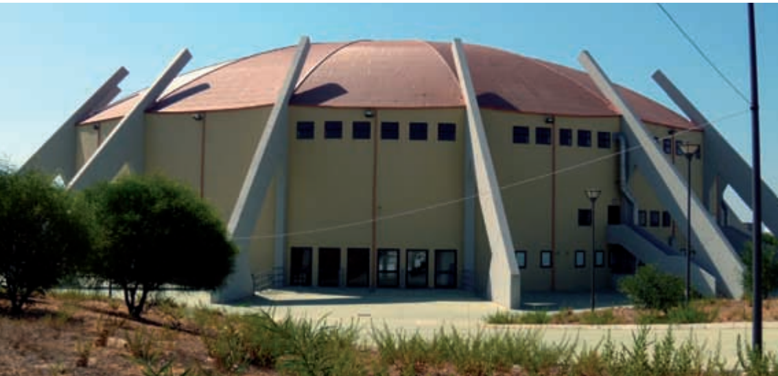
Palazzetto dello sport

E-mail: mtizzano@comune.carbonia.ca.it mmanai@comune.carbonia.ca.it