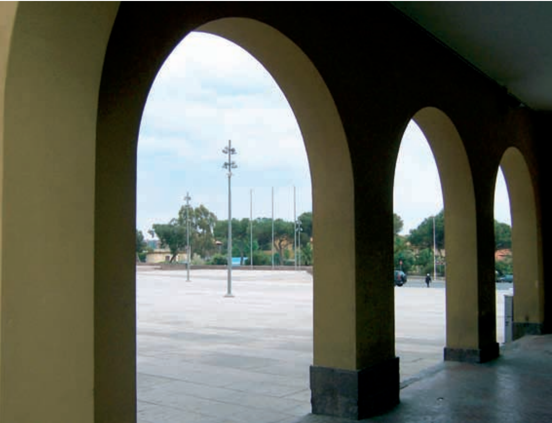
Porticato, piazza Roma

suap.attivitaproductive@pec.comune.carbonia.ca.it